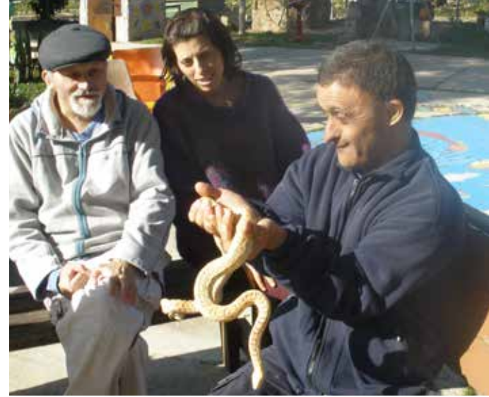
בפינת החי קיבוץ בארי