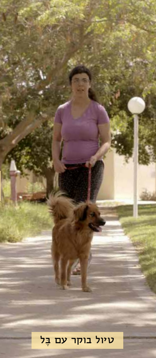
טיול בוקר עם בָּל

את הצבים אנחנו פוגשים בעיקר באביב ובקיץ כשהם מגיחים מהשיחים כדי להתחמם. לפעמים הם אפילו מוכנים לאכול מלפפון או חסה שמגישים להם. צבים הם בעליהחיים היחידים היוצרים מעטפת באמצעות שילוב של צלעות וחוליות. בכל בעליהחיים האחרים, הקליפות החיצוניות נוצרות מקשקשים גרמיים חיצוניים, ואינן קשורות לעצמות.